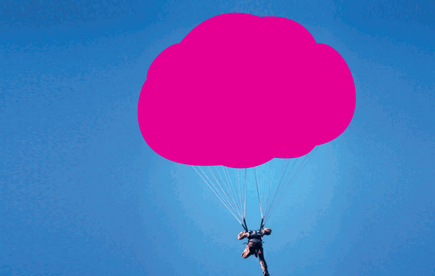
RESISTÈNCIA mecánica y al desgarro Mechanical RESISTANCE to tearing hohe Reiß- und Weiterreißfestigkeit