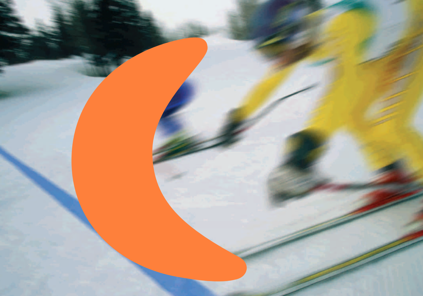
Amplia gama de color Extensive Modern colour range Umfangreiche Farbpalette