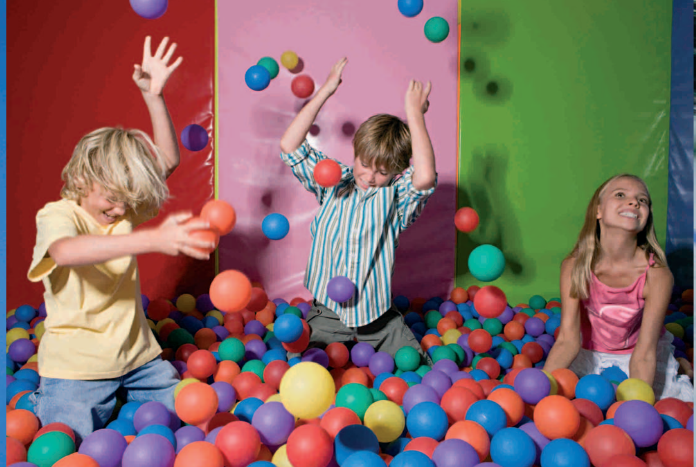
No ponga límites a la imaginación No limit to its range of uses Setzen Sie Ihrer Phantasie keine Grenzen