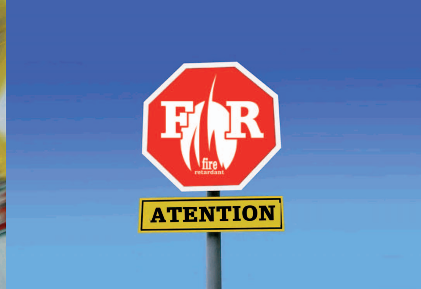
Ignífugo (FIRE RETARDANT) Flame Retardant Feuerfest (FIRE RETARDANT)